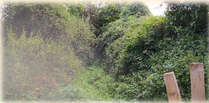
Avant l'intervention des bénévoles

La « chasse des Murs » relie Saint- Floxel à Montebourg en passant derrière la ferme de l'Abbaye et une partie n'avait pas été nettoyée depuis plusieurs années. Ce nettoyage a permis de voir les travaux de remise en état à prévoir afin de la rendre de nouveau praticable pour les randonneurs et les familles à compter du printemps. Cette chasse fait partie de l'itinéraire des chemins Saint-Michel.