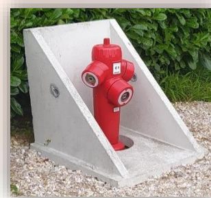
Le poteau incendie situé à La Guinguette route de Saint-Martin

La pose de ces poteaux incendie d'un montant total de 9 513.60 €, n'a malheureusement pas pu bénéficier de subventions.