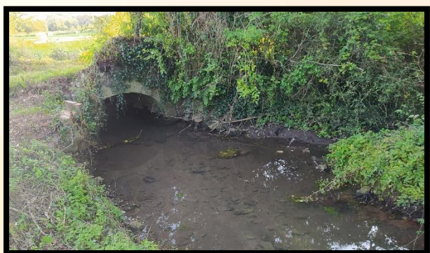
Le pont enjambant le « Coisel » avant

Lors de la réunion du 08/07/2021, le Conseil Municipal avait délibéré de façon unanime pour la pose d'une buse d'un mètre de diamètre sur la parcelle B0005, en parallèle du pont enjambant « le Coisel » avec l'accord préalable du propriétaire.