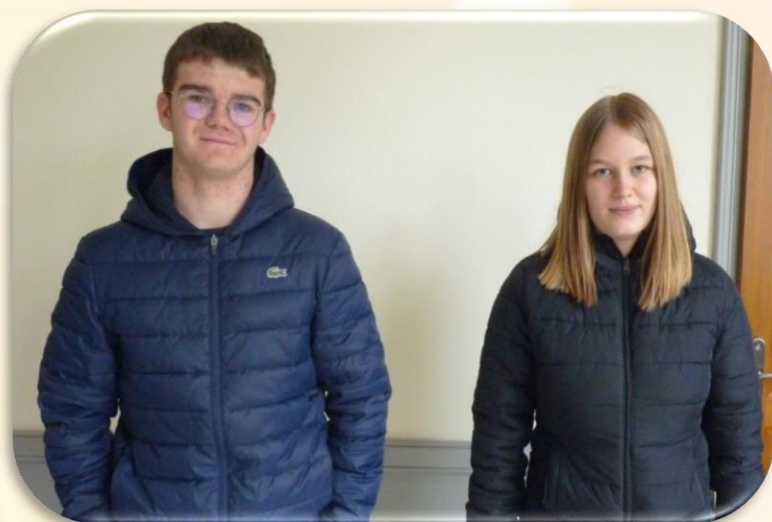
Elsa BAUDE et Tanguy ONFROY, Florent FAUDEMER et Benjamin GUESDON, n'ayant pu être présents.

Depuis le 01 janvier 2021, la bourse au permis pour les jeunes Saint-Floxelais de 15 à 25 ans est en place, suite à la réunion du Conseil Municipal du 27 octobre 2020.