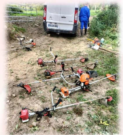
Une exposition de débroussailleuses

Deux tracteurs et remorques, un rouleau compacteur étaient également mis gracieusement à disposition. Des débroussailleuses avaient également été proposées par M.DOGUET, propriétaire d'un magasin de motoculture et avant tout Saint-Floxelais.