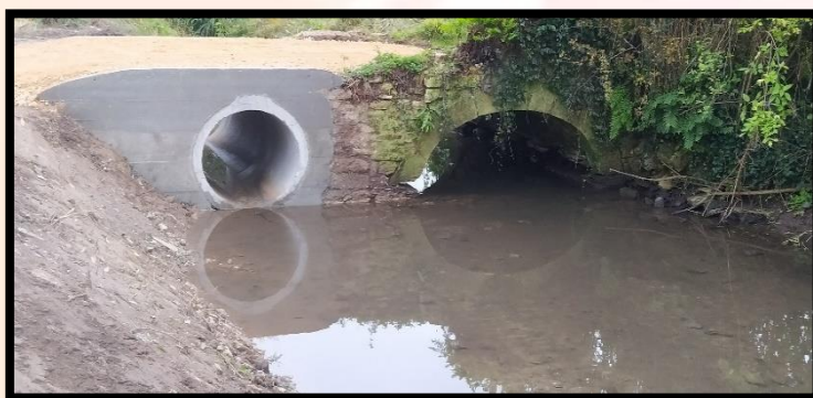
La buse placée de façon à absorber les surcharges du cours

Cette réalisation est une partie de la solution suggérée par le Conseil Municipal avec l'aide du technicien de rivière de la Comité d'Agglomération du Cotentin. A la demande de la DDTM, de l'empierrement devra être mis sur la berge. Deux parcelles en amont vont être achetées par la commune afin de créer une zone humide d'environ 9000 m 2 et une convention de prêt à usage va être établie avec les propriétaires actuels pour pouvoir à des périodes définies, mettre des équidés qui assureront une partie de l'entretien indispensable à son bon fonctionnement.