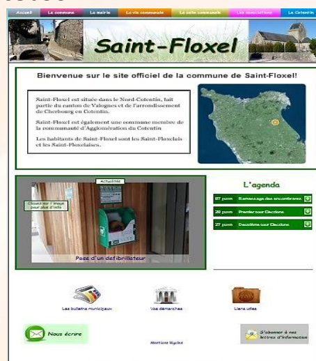
Page d'accueil du site internet

Ces outils nous permettent de vous communiquer les informations communales ou autres et nous nous efforçons de les mettre à jour régulièrement.