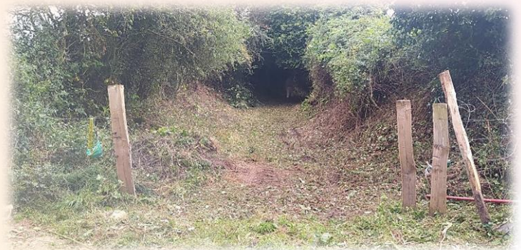
On commence à voir la différence!

Cette journée productive s'est déroulée sous une météo agréable et les travaux initialement prévus réalisés. La répartition des tâches s'est faite sans soucis, chacun ayant vite trouvé sa place et le travail a été effectué avec prudence et respect des distances de sécurité.