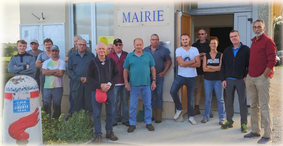
Une grande partie des bénévoles présents au rendez-vous !

Au rendez-vous de 9h00, à la Mairie, 18 bénévoles ont répondu présents équipés de leur matériel.